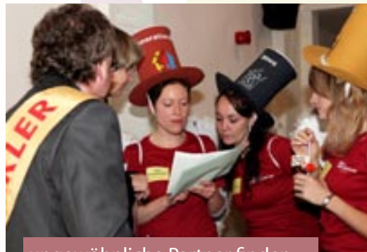
ungewöhnliche Partner finden

Gemeinnützige Einrichtungen können auf dem Marktplatz neue Partner finden, Projekte und Ideen präsentieren und ihre Stärken ins Rampenlicht rücken.