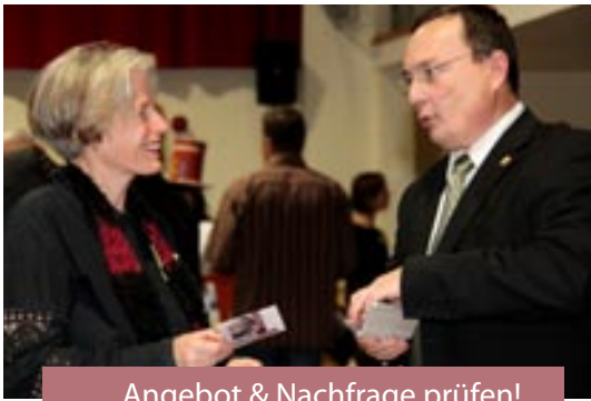
Angebot & Nachfrage prüfen!