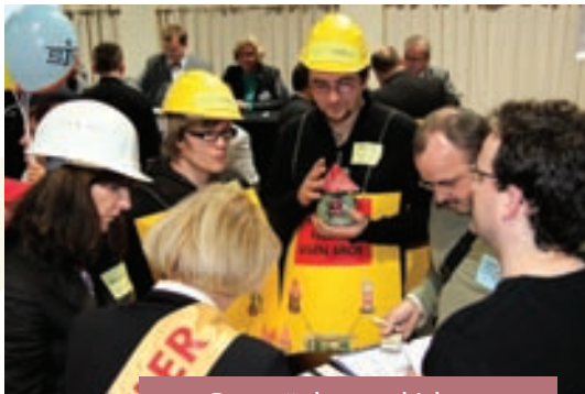
Gespräche und Ideen ...